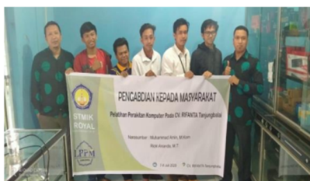
Gambar 4. Foto Bersama Pimpinan CV Rifanta Tanjungbalai.