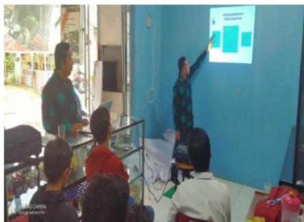
Gambar 3. Foto Memberikan Materi

Adapun foto kegiatan pengabdian kepada masyarakat di CV. Rifanta Tanjungbalai sebagai berikut: